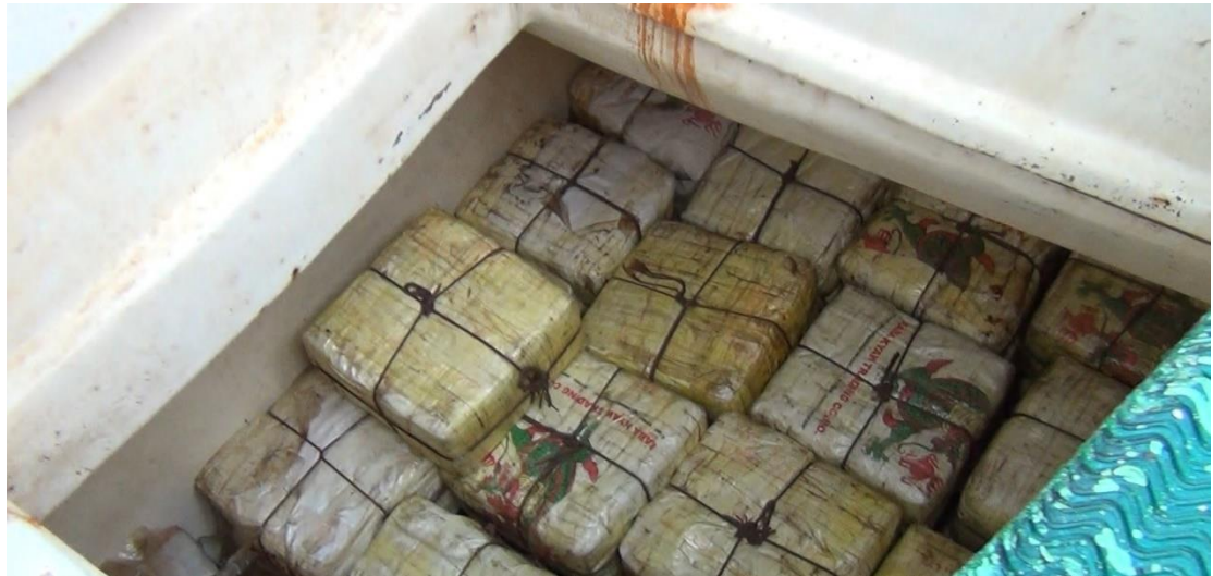
本案第三級毒品愷他命之藏放情形