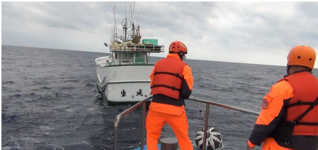
本案海上查緝之過程