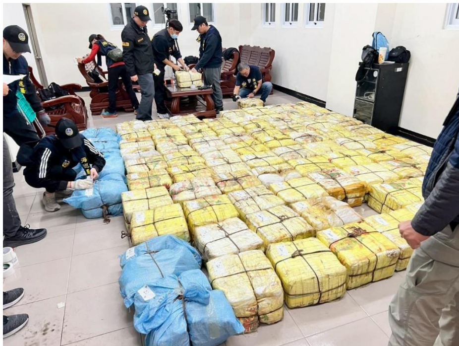
屏檢楊檢察官偵破運輸第三級毒品愷他命 1867 公斤案件