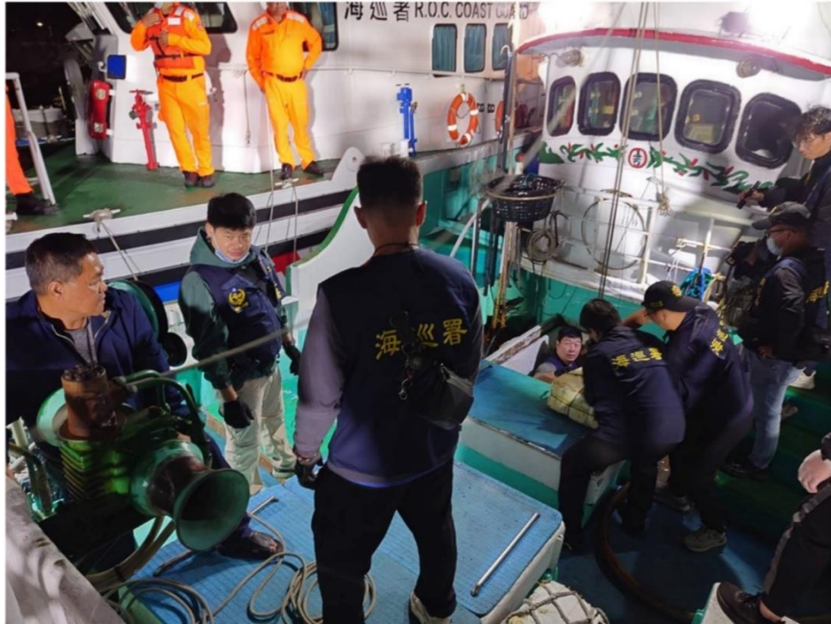
本案起獲第三級毒品愷他命 1867 公斤之過程