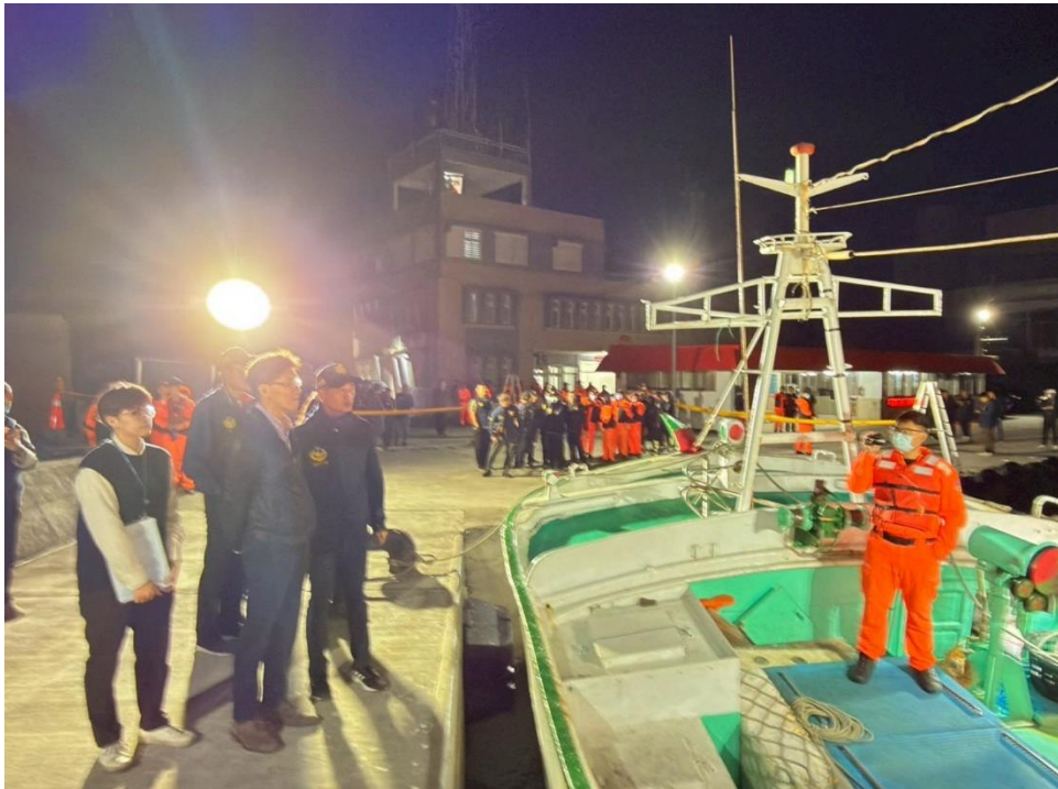
屏檢楊檢察官漏夜抵達東港漁港指揮偵辦之情形