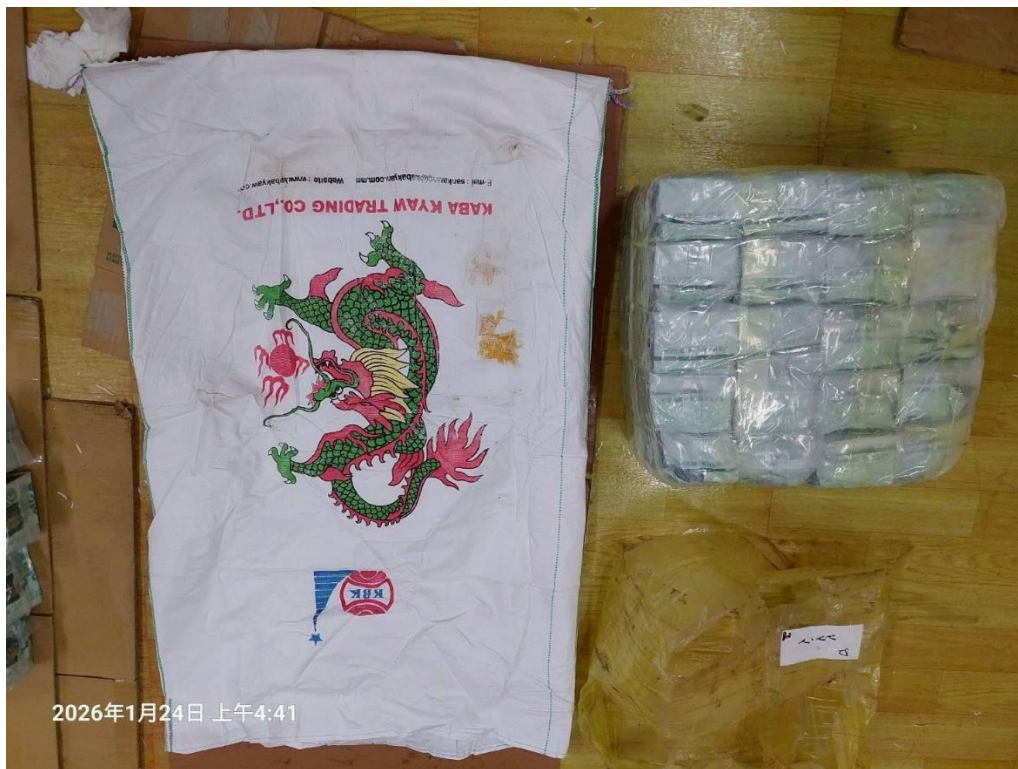
本案運輸第三級毒品愷他命之包裝情形