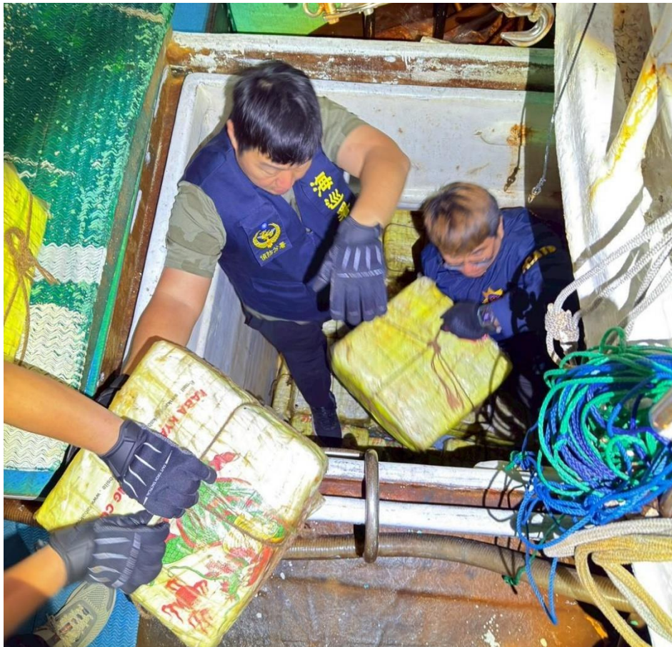
本案起獲第三級毒品愷他命 1867 公斤之過程