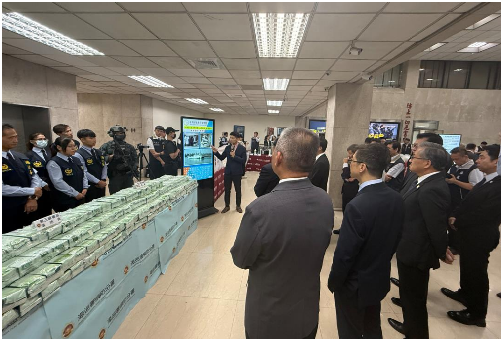
楊檢察官向行政院政務委員林明昕、法務部長鄭銘謙等人說明查獲經過