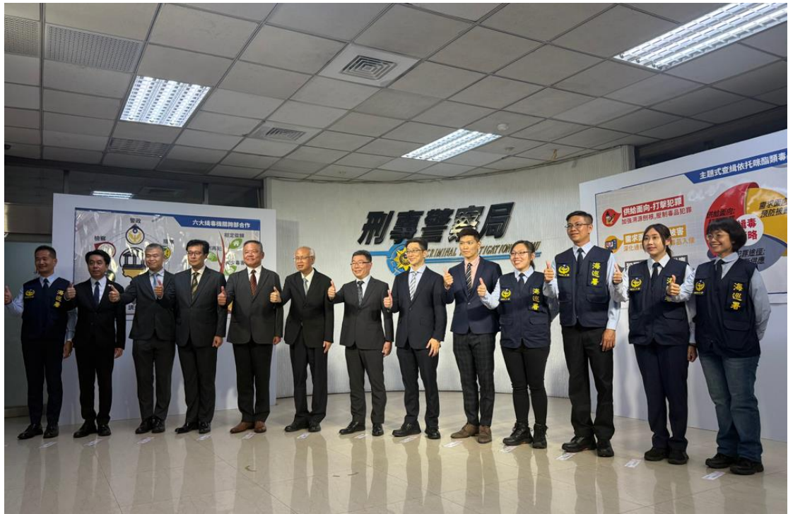
屏檢查緝團隊榮獲表揚