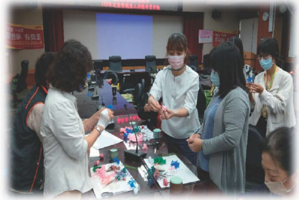
講師帶領榮觀進行紓壓植栽手作課程