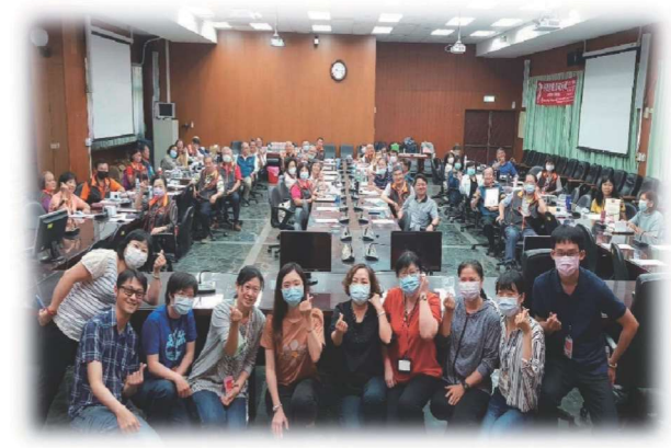
榮譽觀護人訓練研習實況