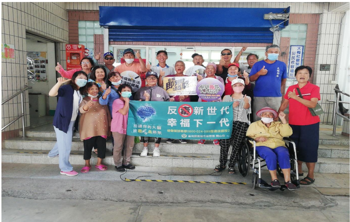
前進大梅社區文健站進行「反賄反毒」宣導