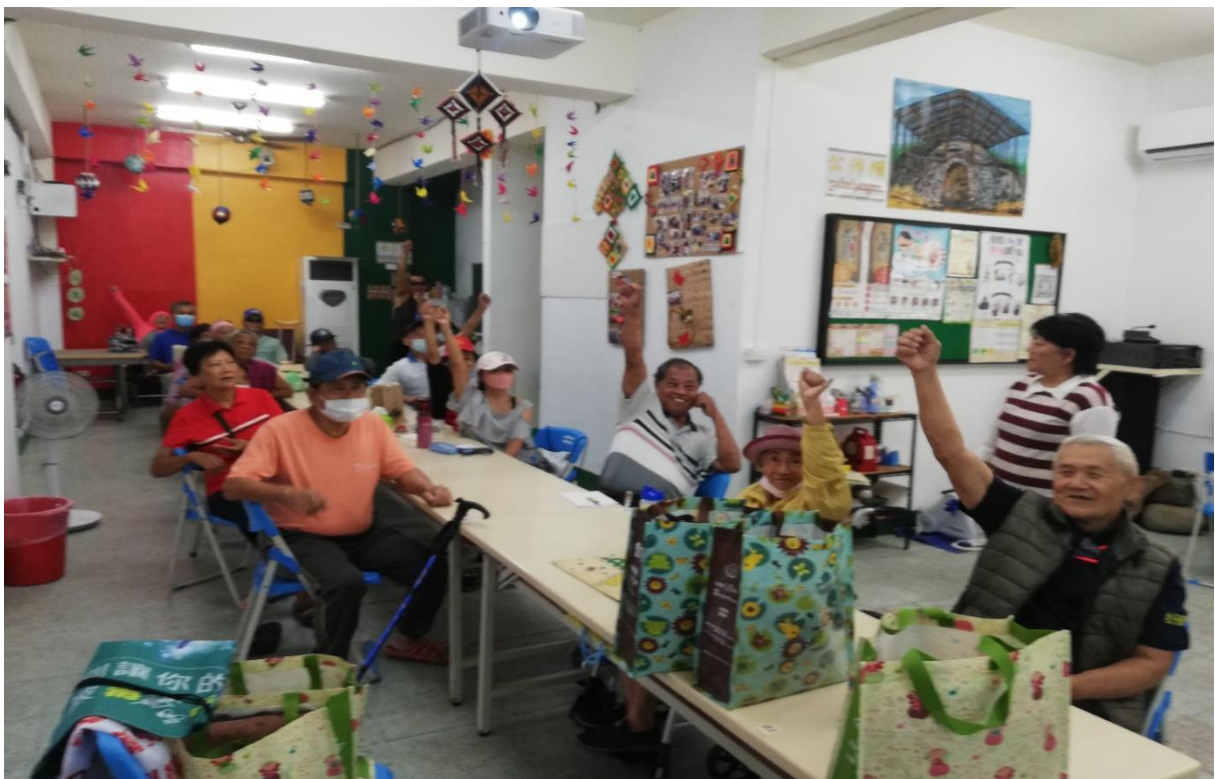
有獎徵答，vuvu 踴躍回答