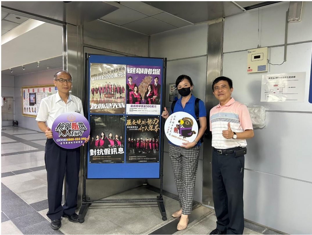
本署政風主任、觀護人兼組長與屏東站長