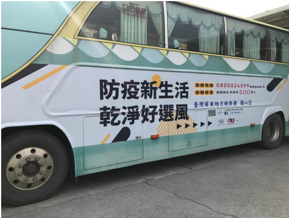
屏東客運兩側放置反賄選宣導廣告