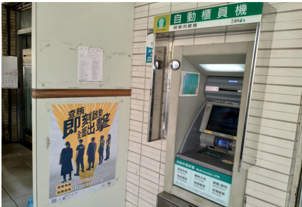
屏東市農會櫃員機張貼反賄選宣導海報