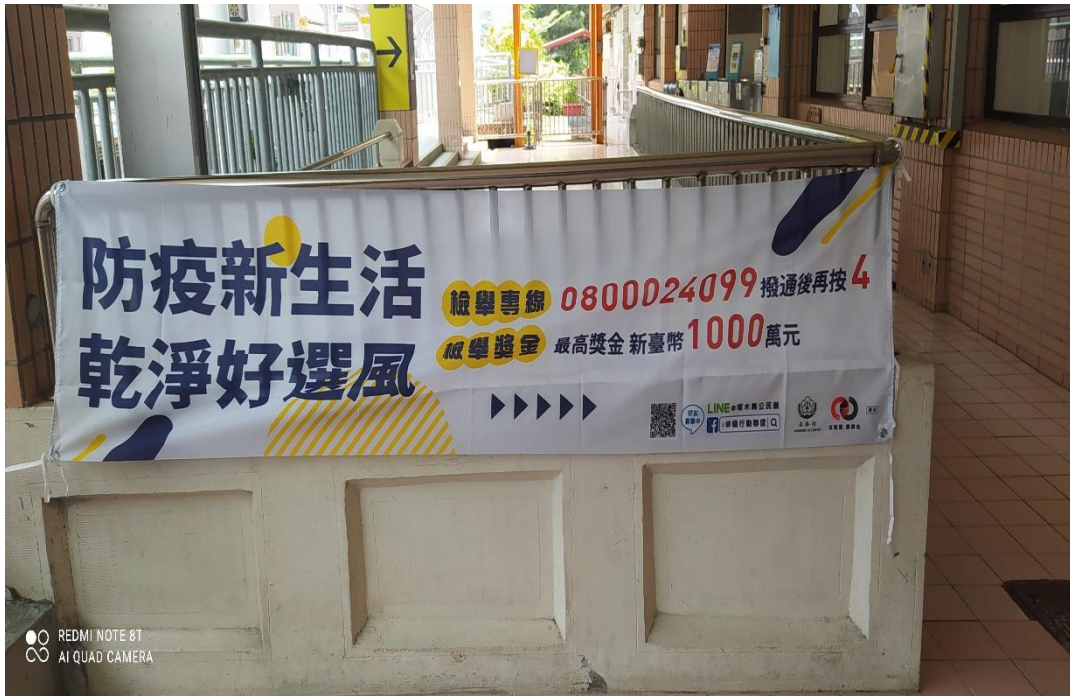
枋寮火車站懸掛反賄選宣導布條