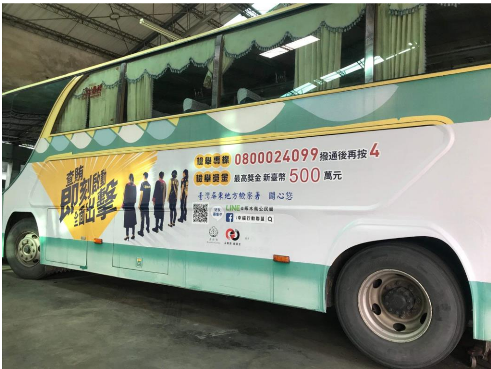
屏東客運兩側放置反賄選宣導廣告