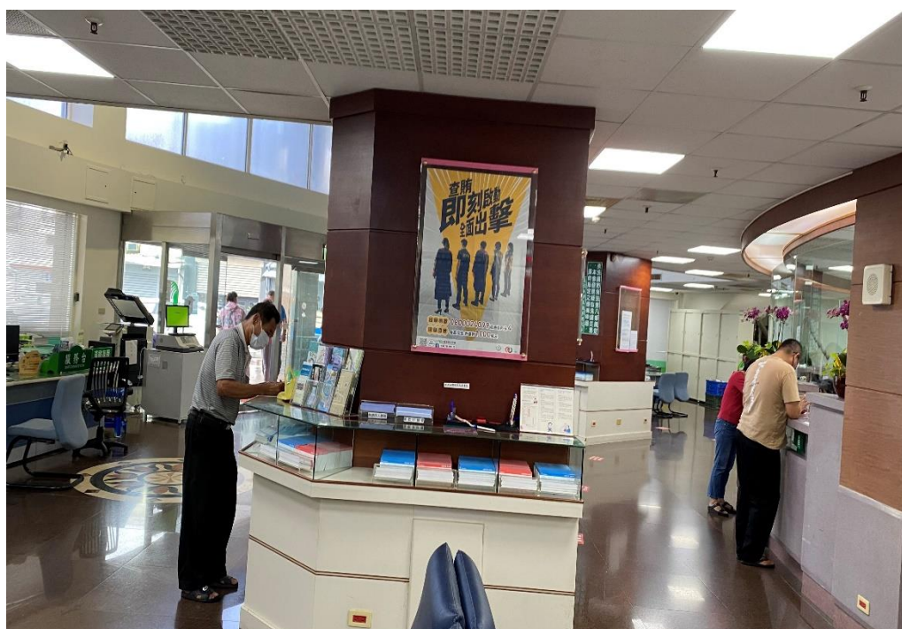
恆春鎮農會信用部張貼反賄選宣導海報