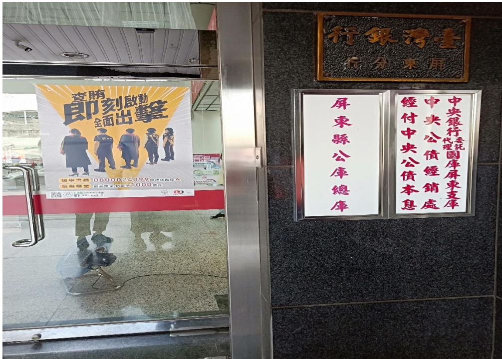
臺灣銀行張貼反賄選宣導海報