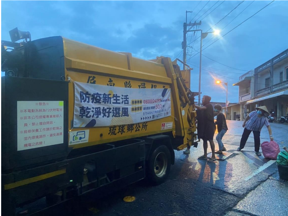
琉球鄉公所清潔車懸掛反賄選宣導布條