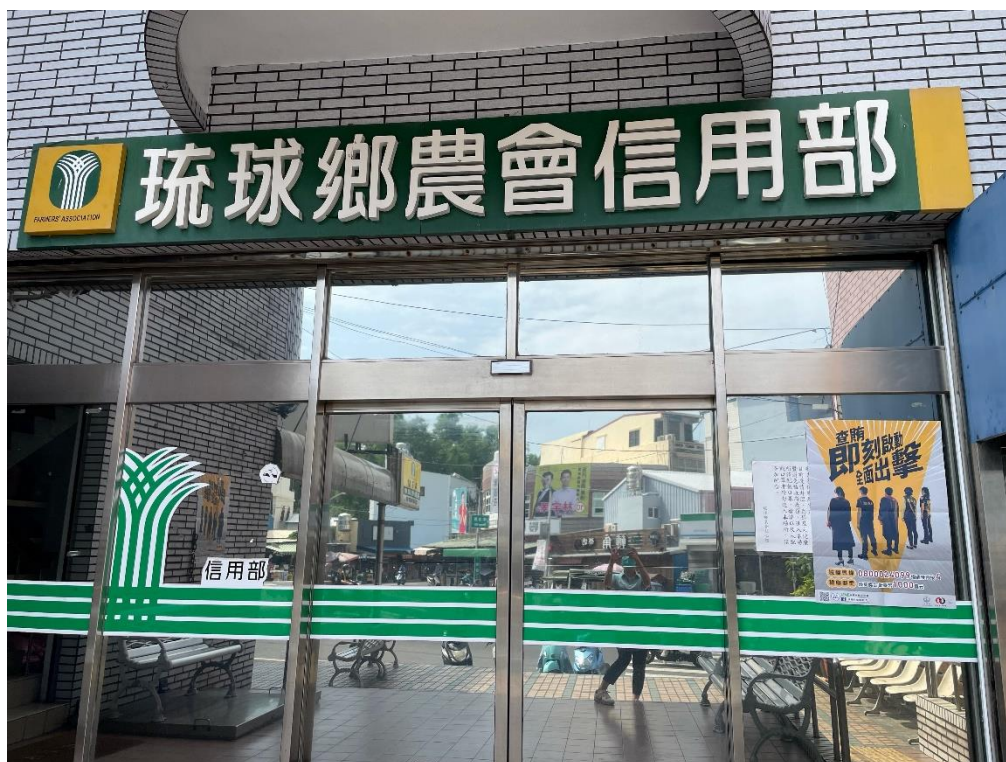
琉球鄉農會信用部張貼反賄選宣導海報