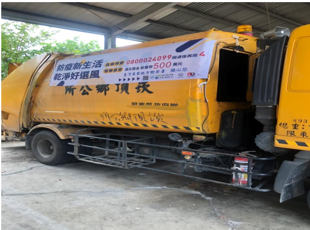
炭頂鄉公所清潔車懸掛反賄選宣導布條