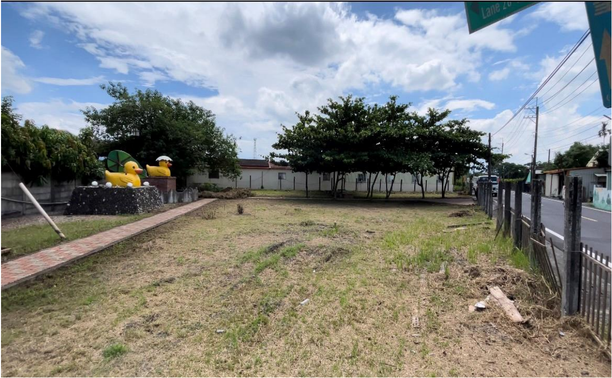
重現鴨鴨興樂園往日風采