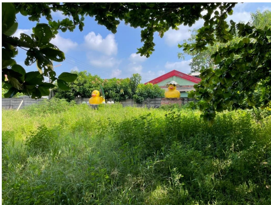
鴨鴨興樂園整理前樣貌