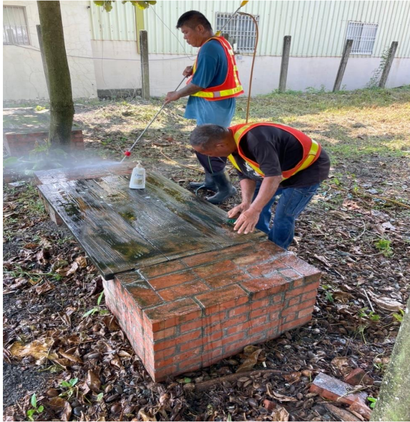
刷洗青苔椅子及地磚