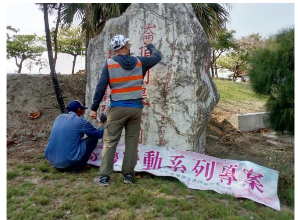
迎賓造景題字油漆