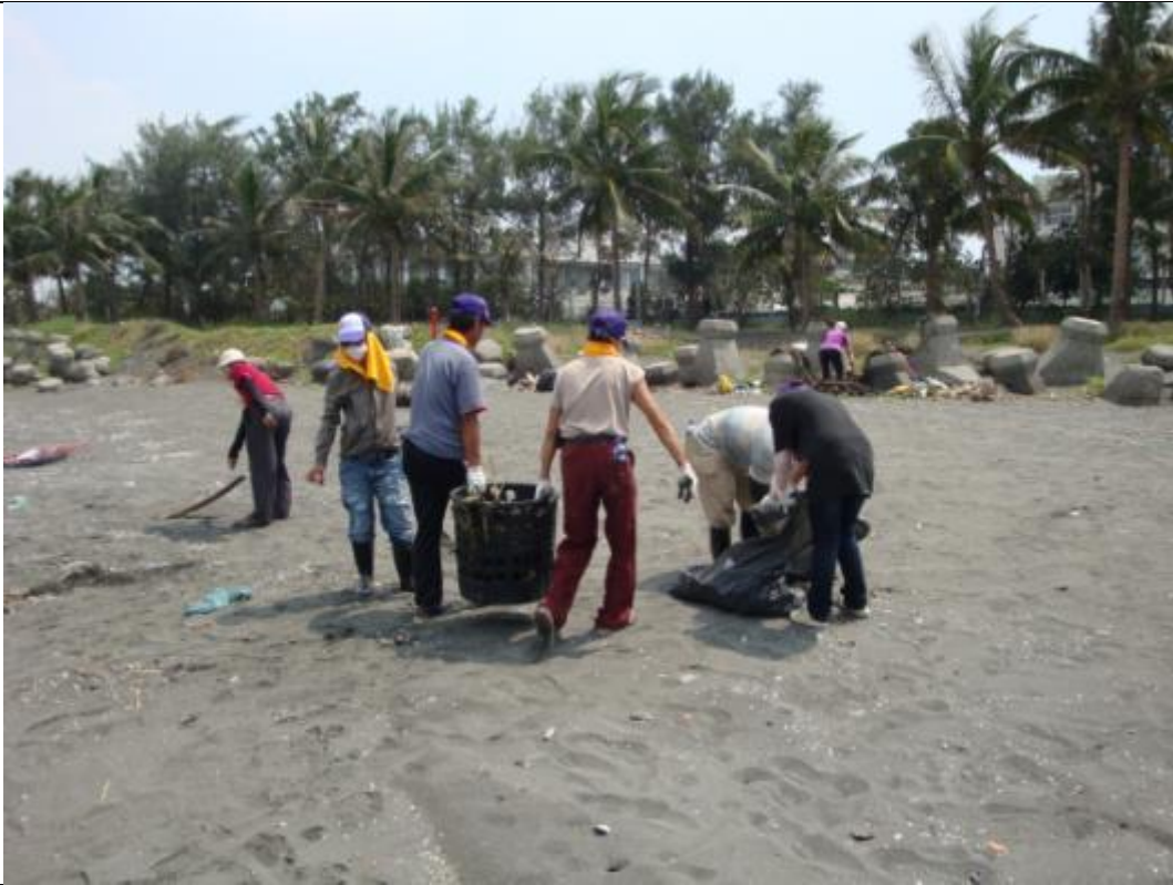
本署社會勞動人執行淨灘(一)