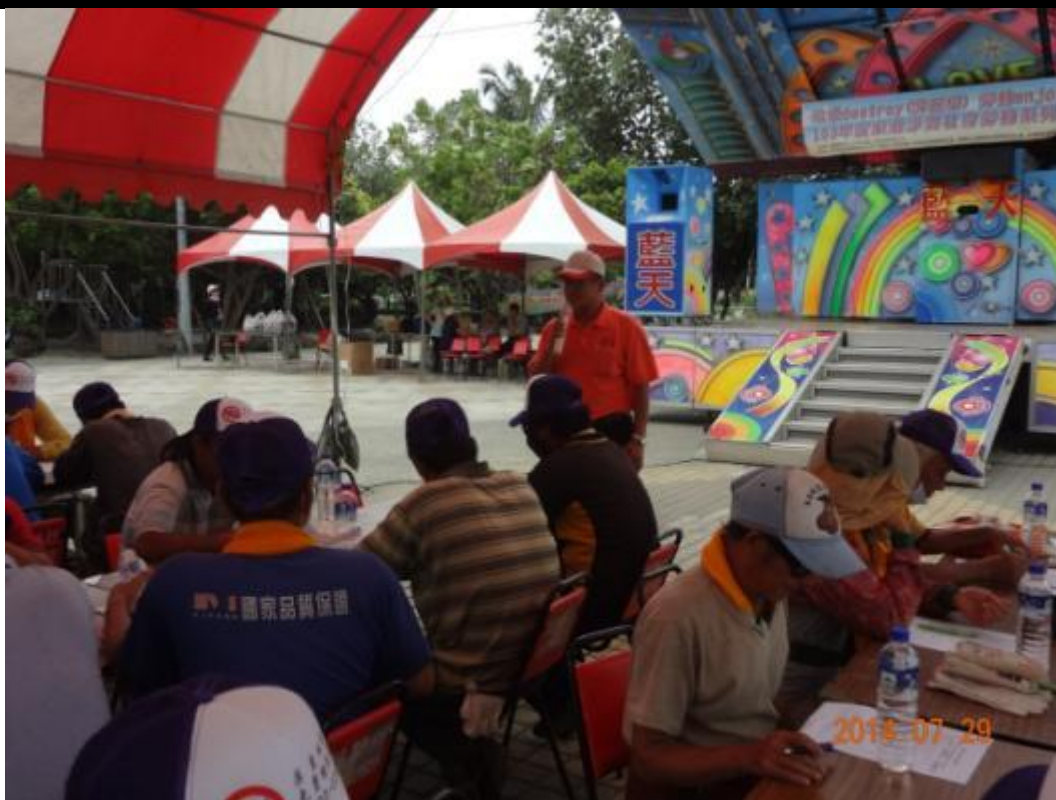
由東港鎮公所清潔隊長進行淨灘前環境教育