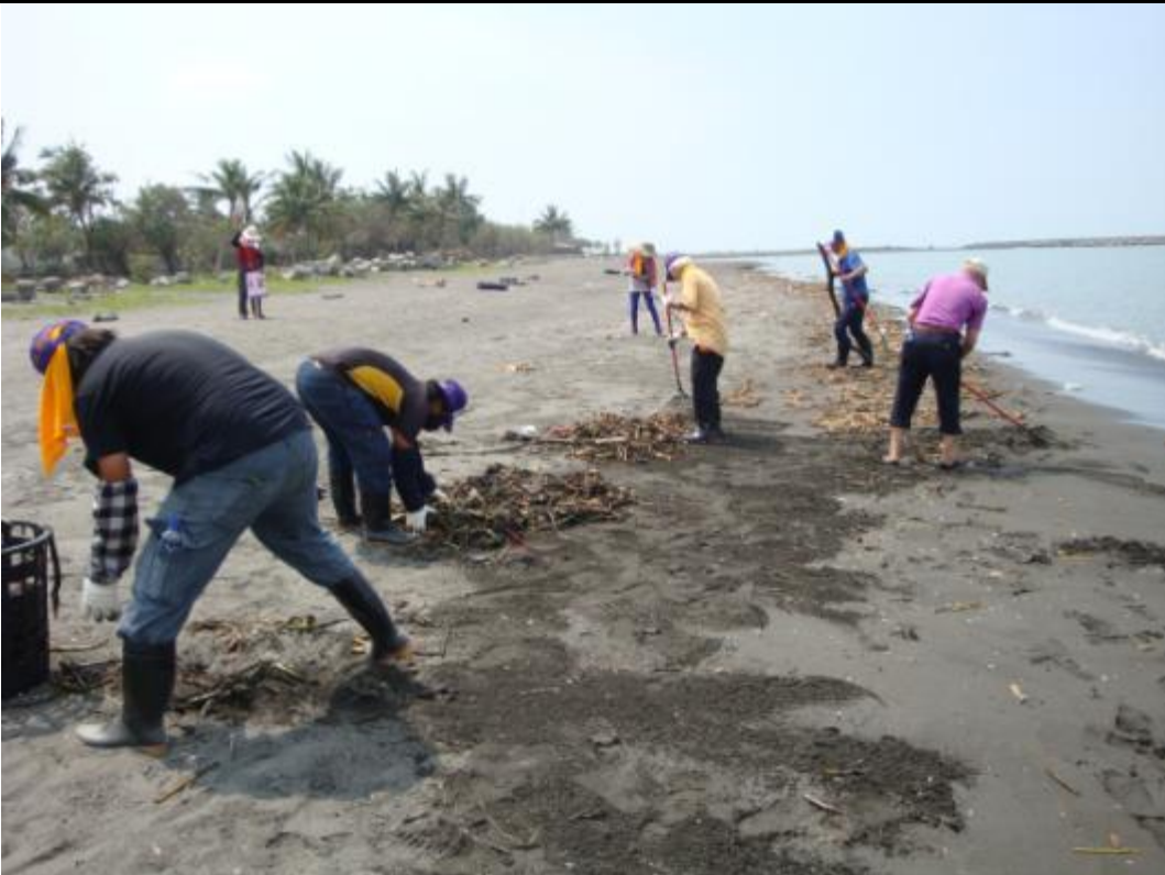
本署社會勞動人執行淨灘(二)