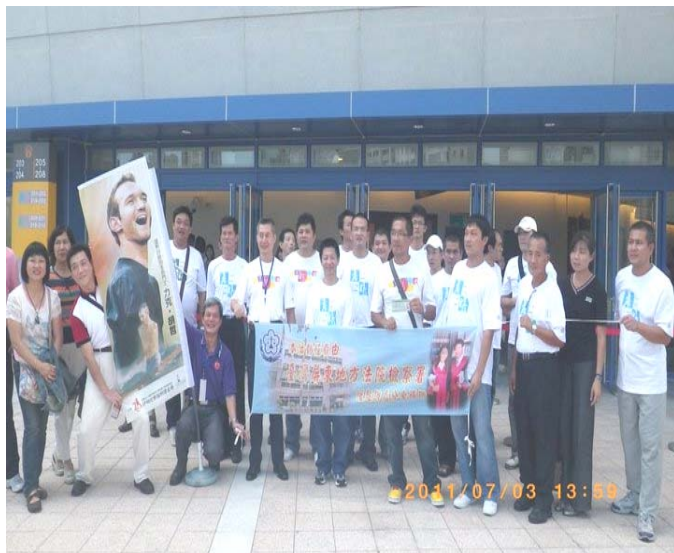
本活動運用屏東地檢署緩起訴處分金補助