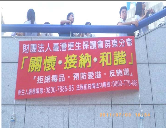
更生保護預防犯罪宣導