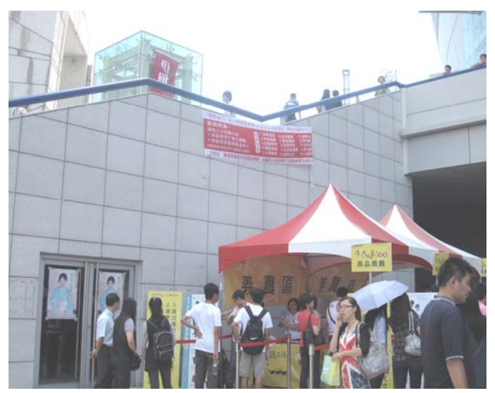
犯保預防犯罪宣導