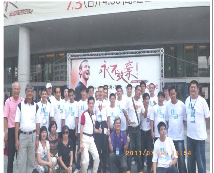
屏東輔導所戒毒學員與高采烈與志工合照