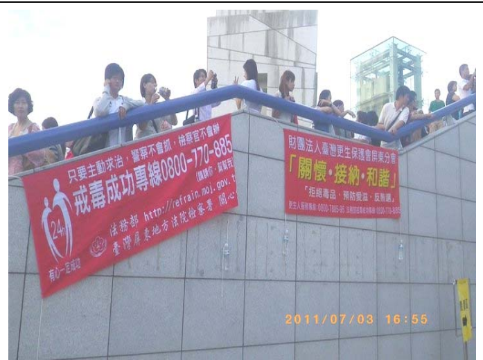
屏東地檢署反毒宣導