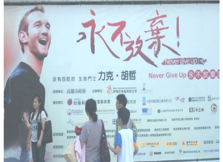
屏東地檢署、更保、犯保為區域協辦單位