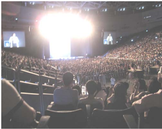
高雄市長陳菊親臨致詞歡迎大家到高雄巨蛋