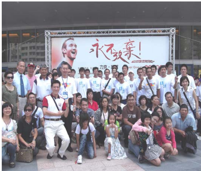
「更生人」、「馨生人」與志工等參與活動大合照