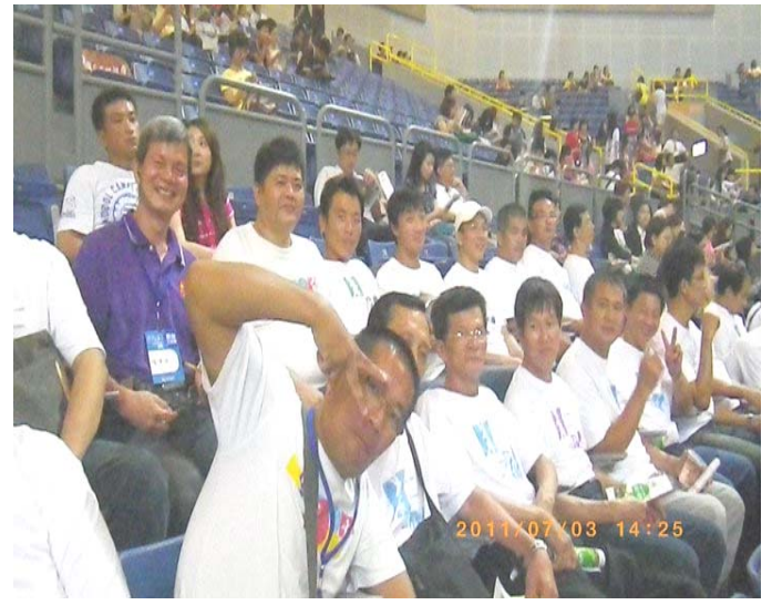
參與學員於會場內殷殷期盼力克演講