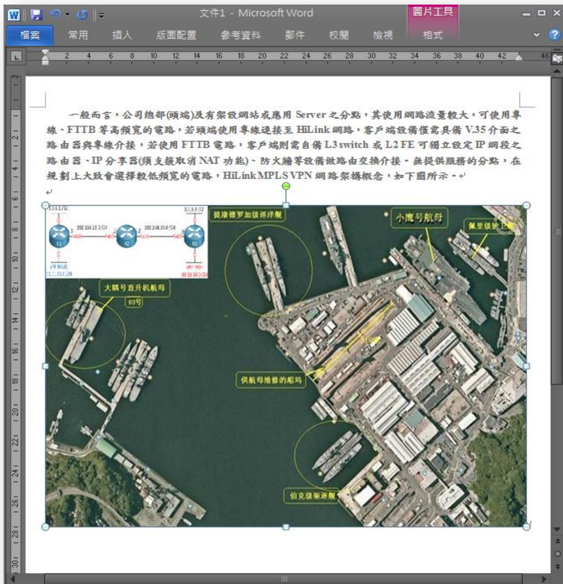
圖 3 調整剪裁區域後恢復原圖大小