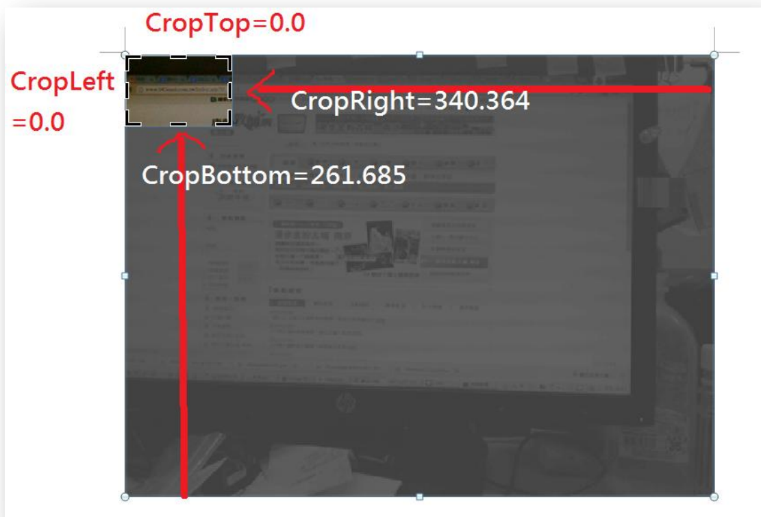
圖 4 PictureFormat 類別 4 大屬性代表意義

如下圖 4 所示，若欲使用程式偵測 Office 檔案中是否包含剪裁圖片，以 Word 檔案為例，只要使用 ActiveDocument.InlineShapes 先列舉檔案中的圖片檔於迴圈內，再取出並判斷 ActiveDocument.InlineShapes[X].PictureFormat 類別的 CropTop 、 CropBottom 、 CropLeft 及 CropRight 的值是否都為 0.0，若有任一值不為 0.0，則該圖就為一剪裁圖片。