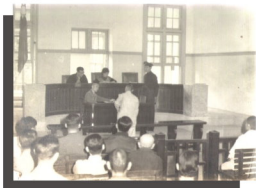
位於屏東市北平路之 屏東地院及檢察處舊址 (42年9月~77年1月)